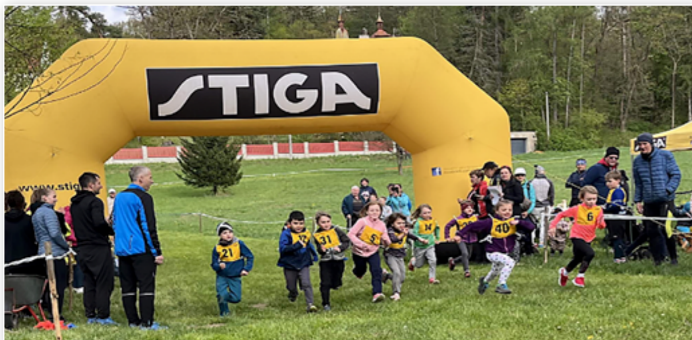
Start závodu na 300 m

V e čtvrtek 18. 4. se v Hrušově pod bývalým lyž. můstkem uskutečnil 61. roč. Jarního běhu. Historie tohoto závodu je pestrá... dlouhá desetiletí se běhalo U Kánalu a tamní prostor se zázemím pod bývalým kamenolomem měl bezesporu své neopakovatelné kouzlo. V roce 2020 však byly zdejší tratě rozsáhlou těžbou suchého lesa (dočasně) zneprůchodněny, takže padlo rozhodnutí přesunout závod kousek dál po proudu Mnichovky na louku pod bývalý skokánek. Zdejší louka nám poskytla skvělý a velký prostor a tratě zejména pro nejml. ktg. jsou zde pěkně přehledné. Závod jsme tak už natrvalo přesunuli do Hrušova. Od letoška jsme pak závod zasvětili našemu kamarádovi lyžaři-běžci-trenérovi mládeže Kyřovi Kohoutovi. Po takřka letním nástupu jara přišlo v týdnu konání běhu prudké ochlazení, chvílemi to vypadalo, že zelenou louku a lesy snad pokryje i sníh... Na to nakonec ve čtvrtek 18. 4. nedošlo, chvílemi i nesměle zahřálo slunce a hlavně stylová pojiždná kavárna s nabídkou teplých nápojů. Nejvíce však samozř. zahřál samotný pohyb-běh a pohodový průběh celé akce. Úderem 17.30 h odstartovali jako první na trati 100 m holky a kluci roč. 2019 a ml. v celkovém počtu 9. Následoval 300m poměrně náročný okruh po obvodu celé louky, kde závodili kluci a holky roč. 2017-18. Zde jsme měli na stupních vítězů 2násobné zastoupení - 2. místo Tonda Pajma a 3. místo Jindra Balcar.