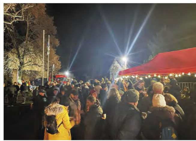
Setkání u betlému rozzářilo nejen betlém, vánoční strom, ale i všechny přítomné, kteří se sešli 26. 11. 2022 u zvoničky k této příležitosti v podvečer první adventní neděle.