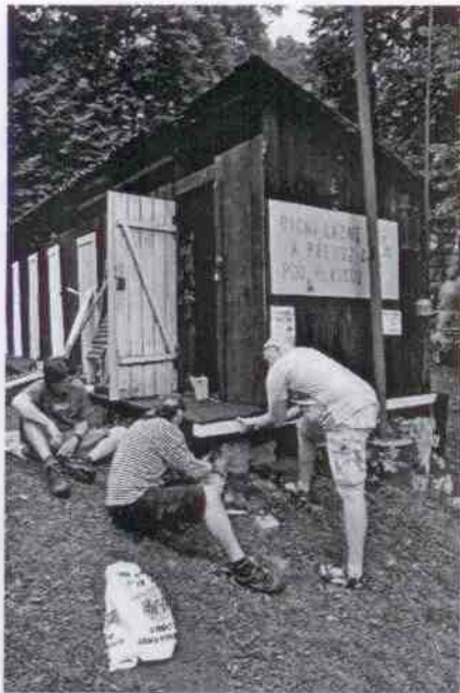
Obr. 1: Oprava uhníklých trámů roštu pod převlékacími kabinami

Uplynulé léto příliš neprálo vodním hrátkám, avšak přesto bylo nutno zajistit provoz říčních lázní na soutoku Sázavy a Mnichovky. Od roku 1997 se tohoto nevděčného úkolu každoročně zhostí členové Občanského sdružení pro obnovu senohrabské plovárny a zachování přívozu, jemuž v posledních letech pomáhají členové společnosti Archaia.